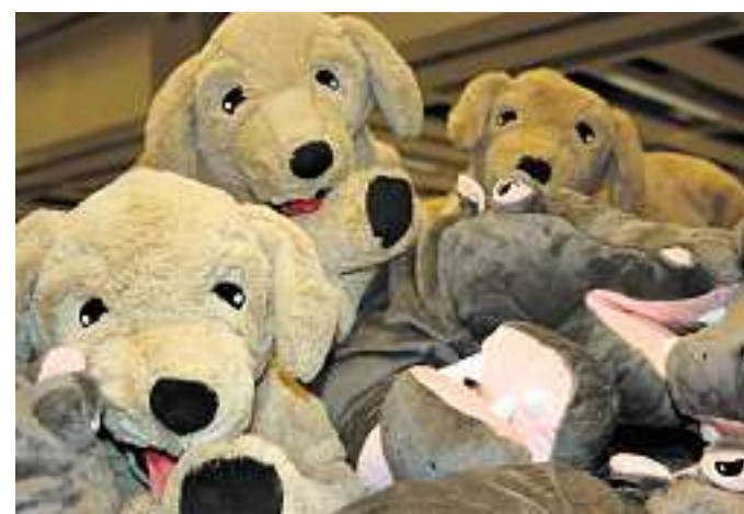
Sind die nicht süß? Da muss man doch zugreifen.

Seit dem Start der Aktion am 1. November wurden im IKEA Erfurt schon 13 000 Kuscheltiere verkauft. „Das ist eine Spitzenbilanz“, freut sich Sloniowski. Bis 24. Dezember spendet IKEA weltweit für jedes verkaufte Stofftier einen Euro für Bildungsprojekte von Save the Children und UNICEF. Dabei ist es unerheblich, was das Kuscheltier kostet. Sogar für die SÖT Barnslig Tiere, die 49 Cent kosten, wird ein Euro gespendet. Eltern, die auf „noch ein“ Kuscheltier im Kinderzimmer ihres Sprösslings lieber verzichten wollen, können das Stofftier auch in eine der an den Kassen-